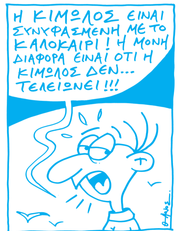
Του Θάνου Λογοθέτη

«Μα σ' εκείνο τον πόλεμο όλοι έδωσαν τη ζωή τους. Τα πόδια τους, τα μάτια τους, τα χέρια τους, την υγεία τους. Εγώ τι έδωσα; Τη φωνή μου, που καλή ή κακή, την έχω ακόμα ακέραη και ζωντανή. Δεν μου χρωστάει λοιπόν τίποτα ούτε το ελαφρό τραγούδι, ούτε η Ελλάδα. Εγώ τους χρωστώ τα πάντα, γιατί αυτά με κάνανε Βέμπο».