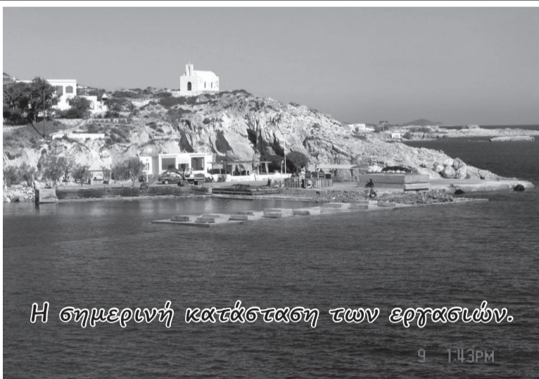
Η σημερινή κατάσταση των εργασιών.