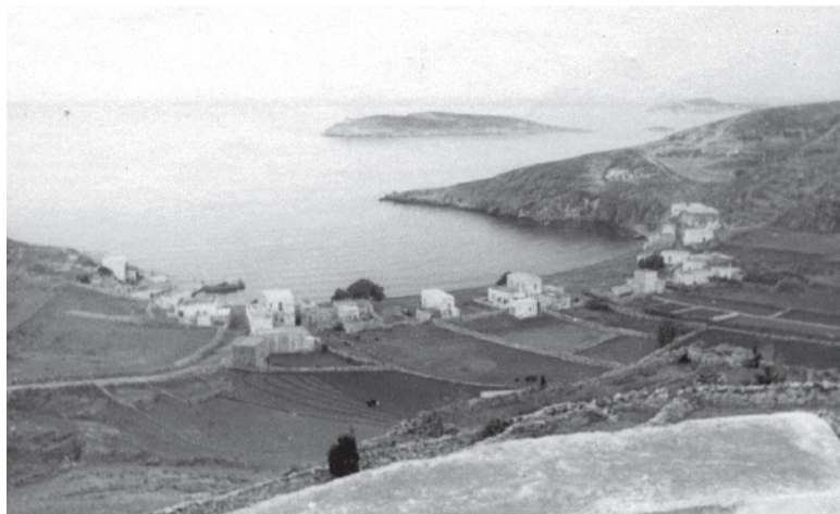
“Ein kleiner Hafen auf Kimolos, 1943” (Ένα λιμανάκι στην Κίμωλο. 1943).