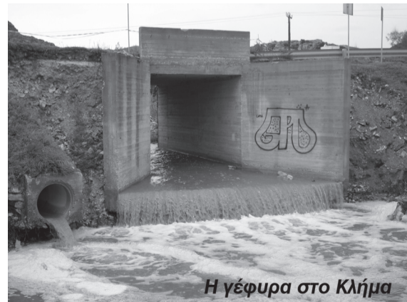
Η γέφυρα στο Κλίμα

Μπορεί να περάσεις μια ζωή γκρινιάζοντας για τη δουλειά σου, για τον κόσμο, για τα παιδιά σου, για τον Δήμαρχο... Κατόπιν πας στο γιατρό και ανακαλύπτεις μια σκιά στην ακτινογραφία σου. Και τότε ξαφνικά συνειδητοποιείς το πόσο ευτυχισμένος ήσουν πριν.