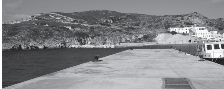
Οι δέστρες έτοιμες στο νέο λιμάνι να δεχτούν συμβατικά και ταχύπλοα πλοία