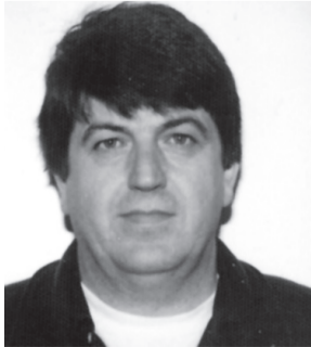
Στις 7/9 κηδεύτηκε στην Κίμωλο.